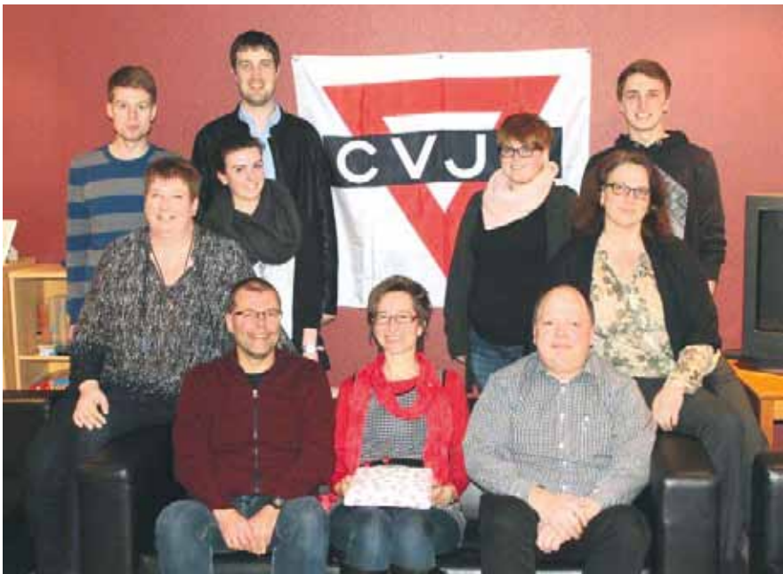
Der Vorstand 2015: