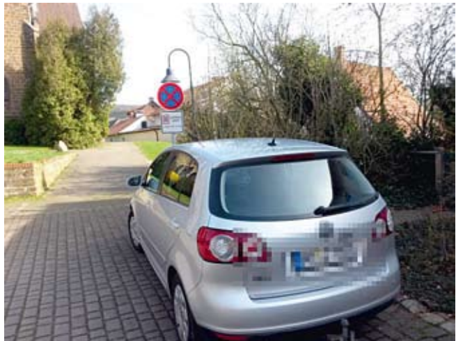
Hier kommt kein Einsatzfahrzeug mehr durch!

Dazu gehört, dass Brandschutzbeauftragte benannt